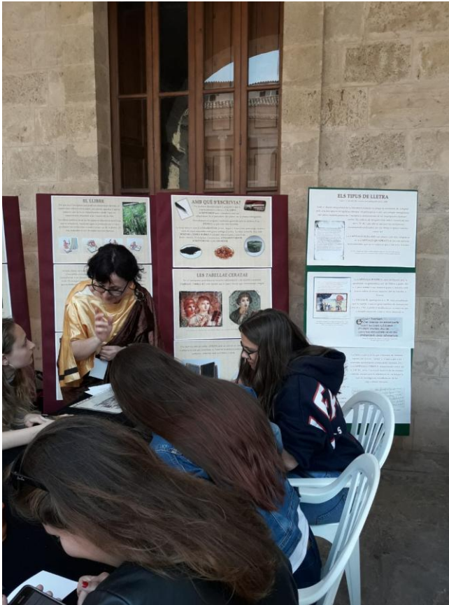
Esriptura damunt pergami.