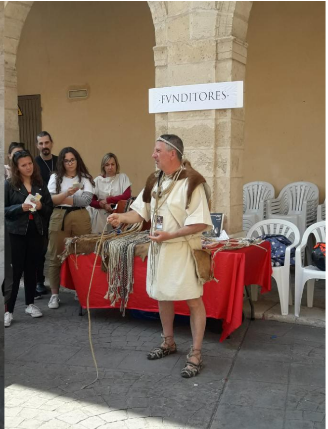
Llançament de fona.